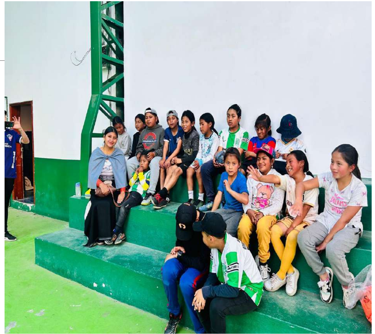
PROYECTO DEL FÚTBOL EN GUALSAQUI-CASCO URBANO