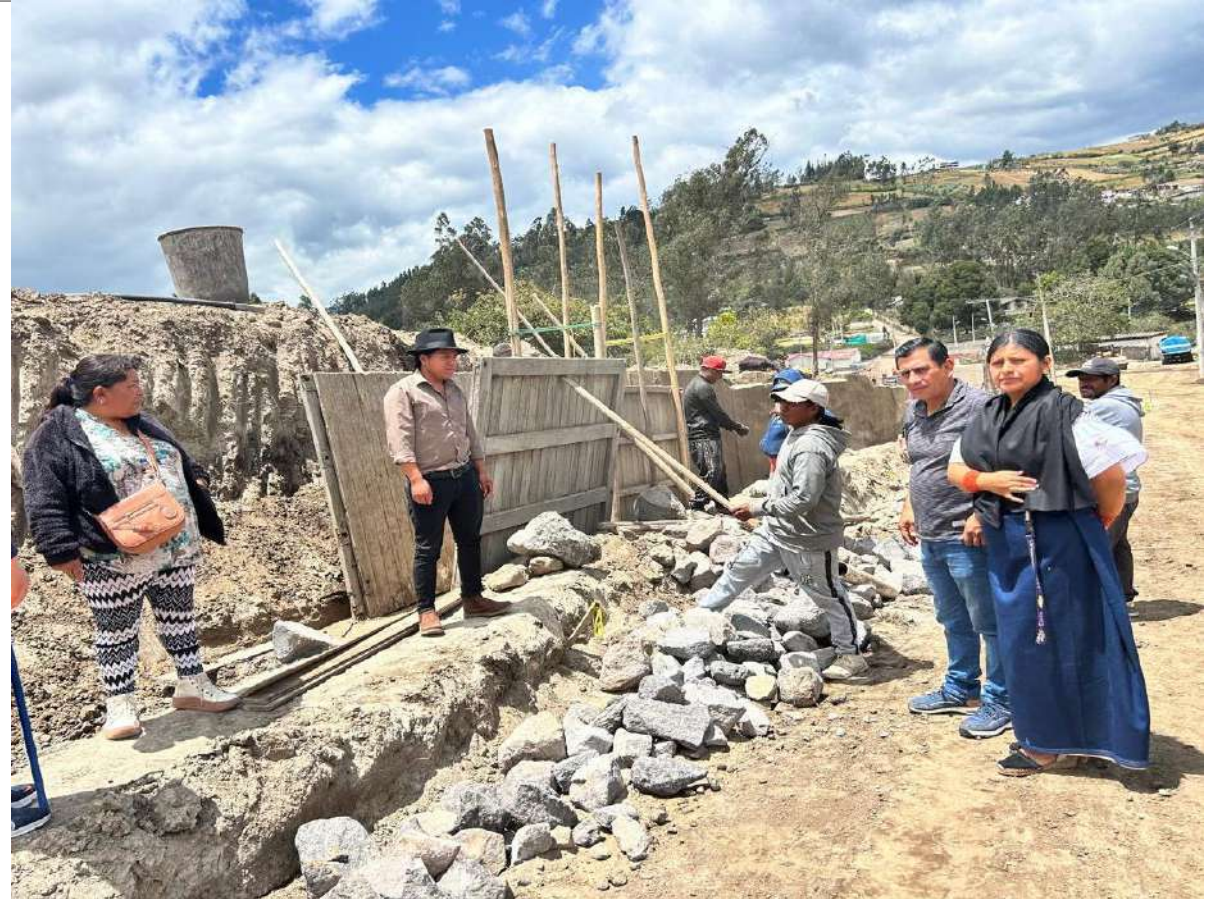
VÍA OTAVALO QUICHINCHE-CONSTRUCCION DEL TAPIAL EN EL MES DE AGOSTO