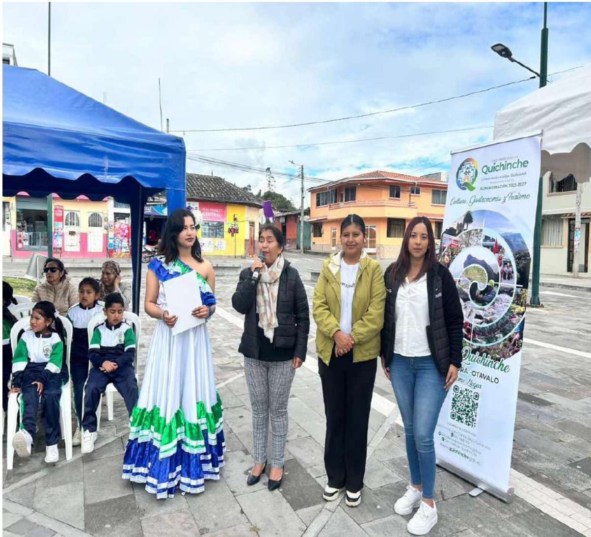
PROYECTO DEL DÍA DEL NIÑO EN EL MES DE JUNIO