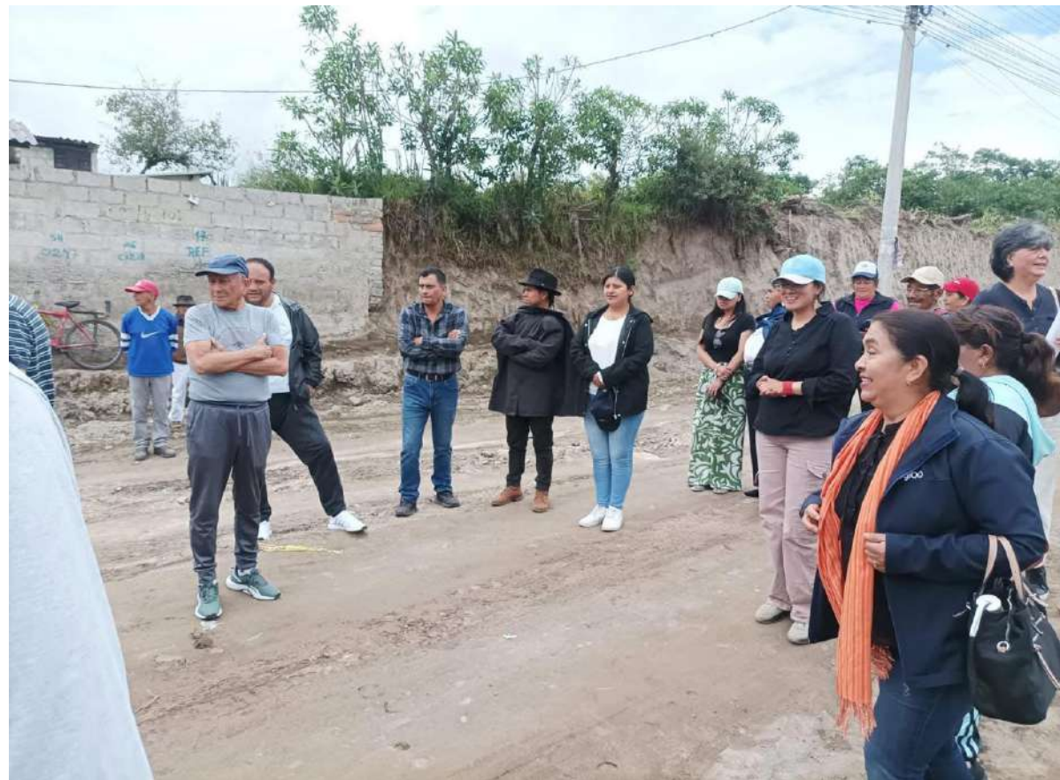
FISCALIZACIÓN , SOCIALIZACIÓN DE LA VÍA OTAVALO QUICHINCHE