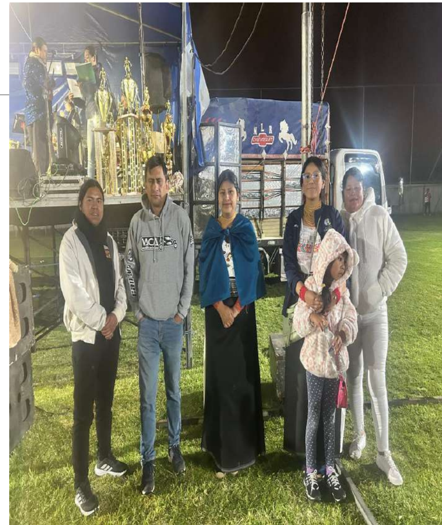
Organización de Fútbol 2da Edición UNIDOS POR EL DEPORTE 2025 en el mes de Agosto.