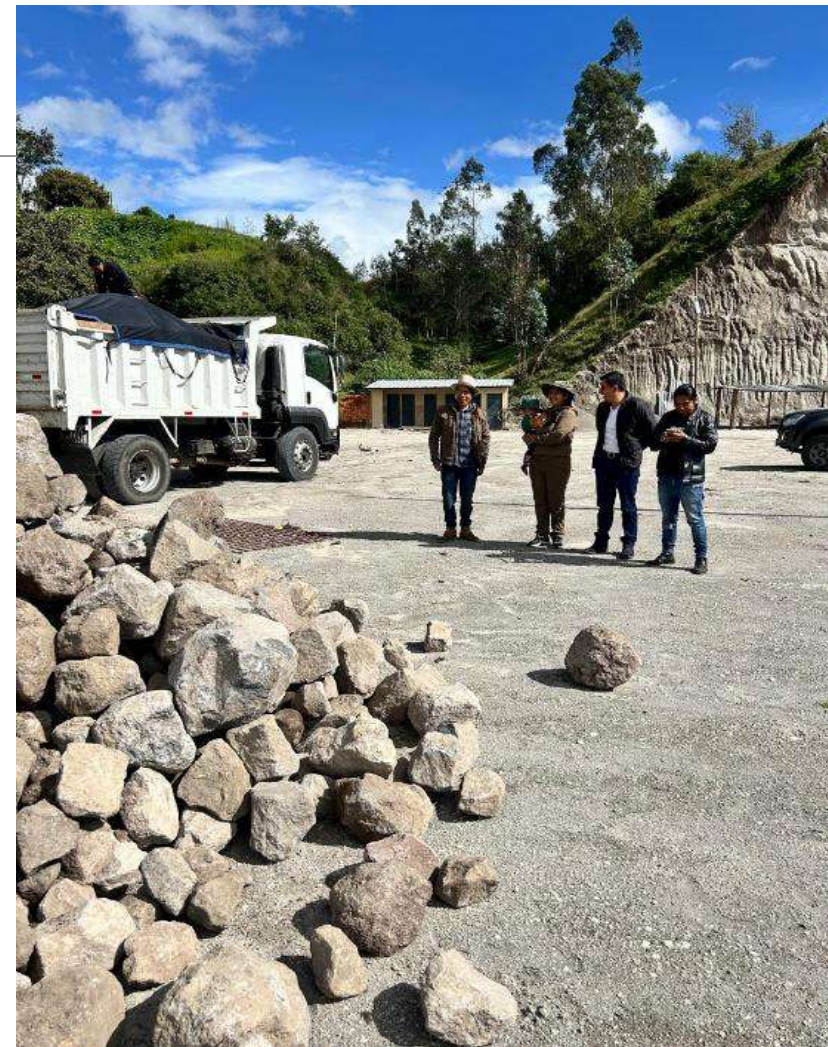
PROYECTO DE PASOS DE AGUA EN LA COMUNIDAD DE CUTAMBI.