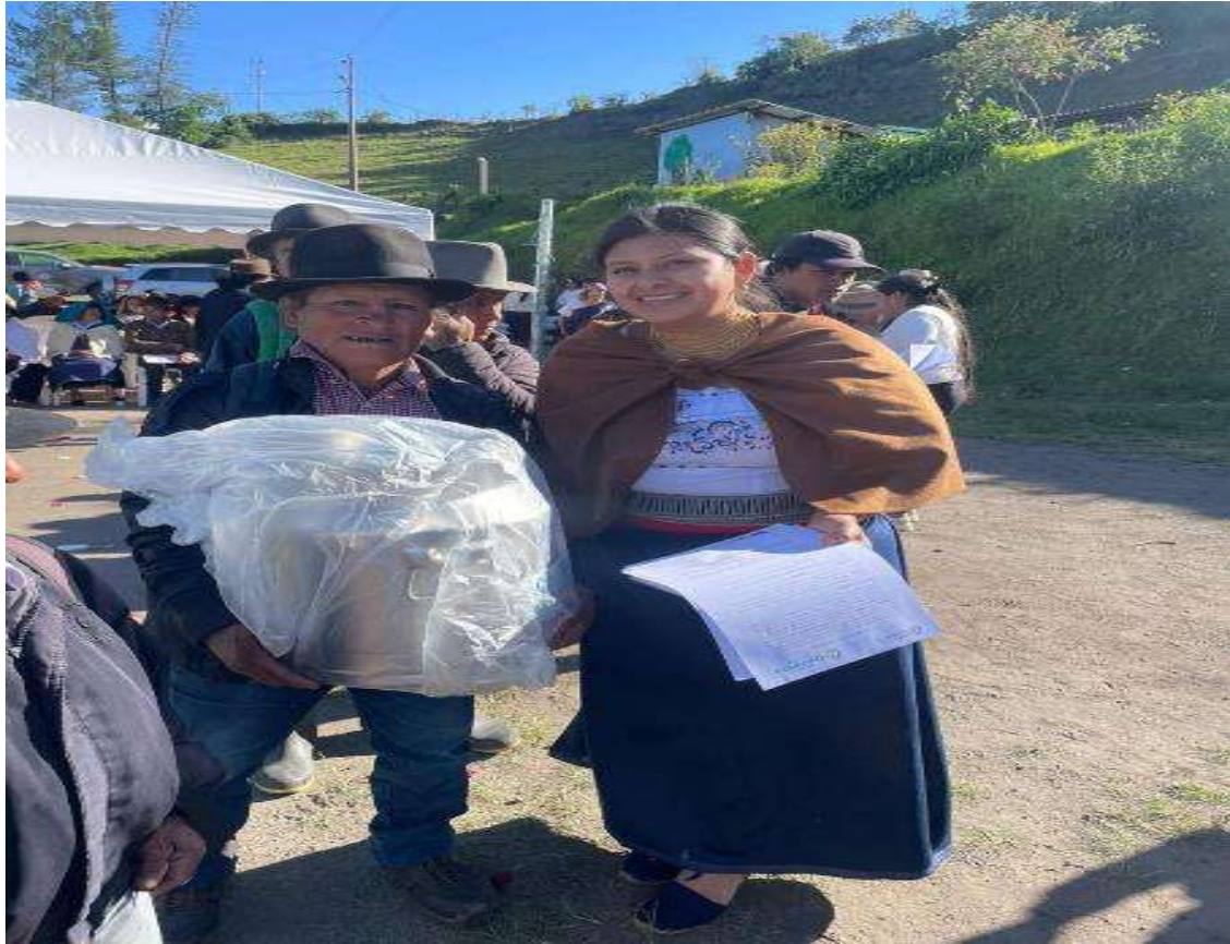
Proyecto de Eje Productivo con presupuesto participativo del Gobierno Provincial de Imbabura –Entrega de kits , bidones.