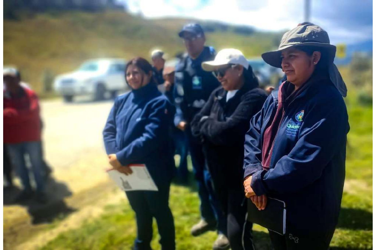
Reunión en MTOP, por el tema Vía Selva Alegre km 0 al 27