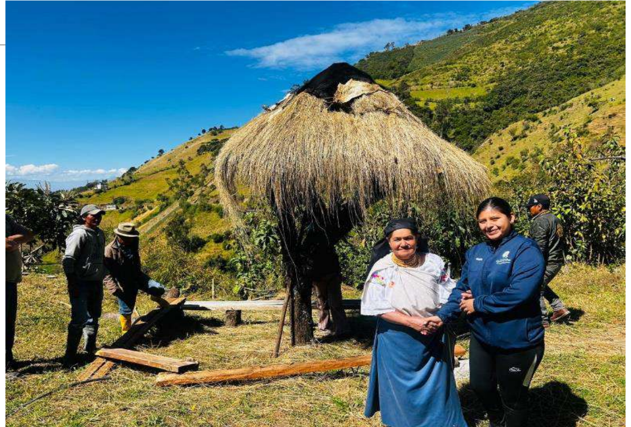
Proyecto de Eje Productivo TALLER PECUARIO en el mes de Agosto en la Comunidad de Padre Chupa