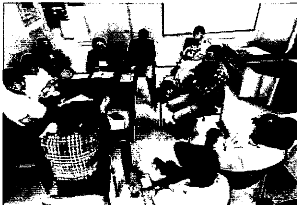
Anexo N.º 13