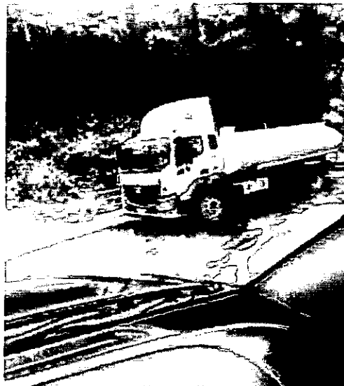
Anexo N.º 07