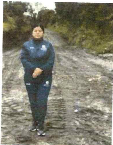
Anexo N.º 03