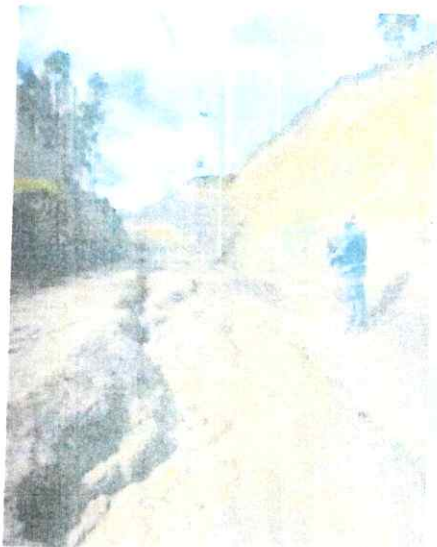
Anexo N.º 06 -07