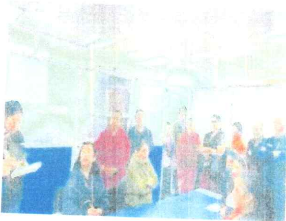
Anexo N.º 12-13