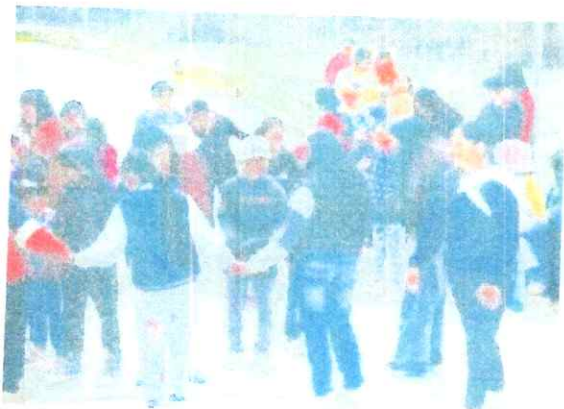
Anexo N.º 10-11